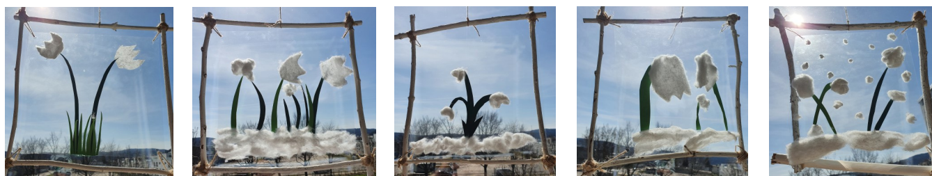
Gestaltung 5./6. Kl. Bauer