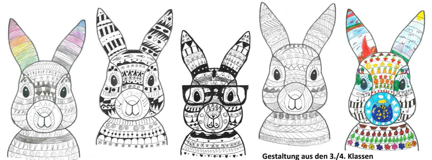
Gestaltung aus den 3./4. Klassen